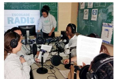
Escouade radioactive au secondaire : élèves de l'école secondaire Henri-Bourassa de Montréal-Nord en préparation de leur émission de radio.

Les élèves, accompagnés du formateur de communication radio, sont également invités à participer à une multitude d'activités dans leur communauté pour mettre en pratique leurs habiletés. À titre d'exemple, les Maisons de la culture deviennent des lieux privilégiés pour leur faire vivre des expériences formatives (entrevues, reportages, vox pop, etc.).