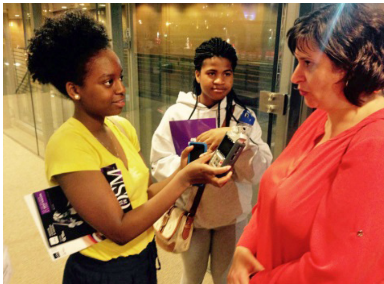
Concert et chronique culturelle à la Maison symphonique de Montréal, le 12 mai 2016 : les jeunes journalistes ont eu la chance d'y entendre Petrenko diriger la Première de Malher.

Boscoville 2000, par le biais du projet Citécoute.ca, est conscient de l'importance de mettre en place, le plus tôt étant le mieux, des moyens pour amener les jeunes à devenir des locuteurs compétents afin qu'ils puissent prendre leur juste place dans la société. Emploi et Développement social Canada place d'ailleurs la communication orale