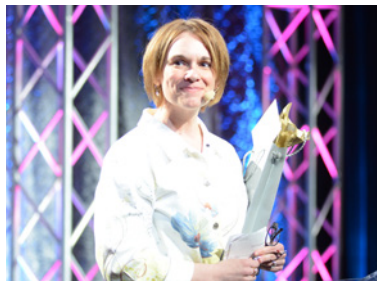
Conférence d'ouverture d'Angela Aucoin

Cette sixième édition du congrès a été un franc succès grâce à la participation de près de 420 intervenants des milieux scolaires et sociaux provenant des quatre coins du Québec. Quelque 46 ateliers et conférences, dont huit en anglais, ont proposé des contenus enrichissants et de qualité sur des thèmes portant entre autres sur la sécurité et la violence à l'école, les milieux spécialisés, la santé mentale, la petite enfance, l'accompagnement dans les milieux scolaires et l'autisme. Le congrès a débuté en force avec une prestation musicale unique pour notre congrès. Avec rythme, l'artiste rap Webster, en collaboration avec des danseurs du Studio Party Time, a illustré comment les intervenants pouvaient faire la différence dans la vie des jeunes en difficulté. S'en est suivie une conférence d'ouverture humaine et touchante intitulée « Des soins attentifs qui peuvent faire toute une différence! » de la professeure Angela Aucoin de l'Université de Moncton. Le congrès s'est terminé sur une note d'espoir et de dépassement de soi avec une conférence de clôture riche en émotions de l'athlète et fondateur du Grand Défi, Pierre Lavoie. Les congressistes sont repartis avec la conviction qu'ils peuvent faire une réelle différence dans la vie des jeunes et les amener à se dépasser quotidiennement afin qu'ils deviennent de futurs citoyens engagés, autonomes et qui feront à leur tour une différence autour d'eux.